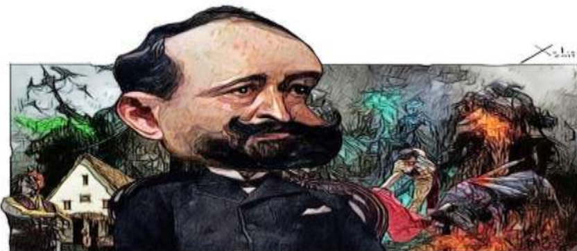
VICENTE BLASCO IBÁÑEZ, REPUBLICANO Y FEDERALISTA

23 Y a la compañía de teatro universitario ambulante "El Buho", fundada en 1934 para recorrer nuestros pueblos de la provincia de Valencia. Wikipedia el Buho Dona havia de ser: La Misiones pedagógicas